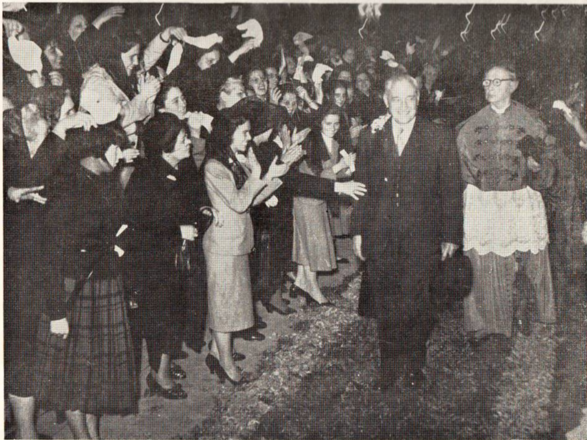
À SAÍDA DO TEMPLO FOI ALVO DE CARINHOSA E VIBRANTE MANIFESTAÇÃO