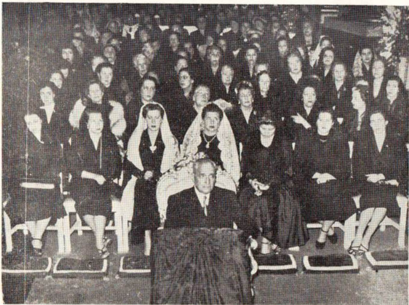
SALAZAR ASSISTE, NO TEMPLO DE S. DOMINGOS, LISBOA, A MISSA QUE AS MULHERES DE PORTUGAL MANDARAM CELEBRAR EM SUA INTENÇÃO