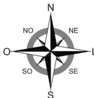
Fig. 3 – Pontos colaterais

Orientação pelo relógio — De dia e em qualquer lugar do nosso país nos podemos orientar pelo relógio. Para isso devemos ter o mostrador em posição horizontal tendo o ponteiro das horas voltado para o lado onde está o Sol. O ponto cardinal Sul é indicado pelo ponto do mostrador que está situado no ponto médio do arco que vai da hora marcada pelo relógio à hora em que o mostrador marca o meio-dia. Se, por exemplo, forem oito horas da manhã, o sul fica da direcção do ponto onde o relógio marca as dez horas.