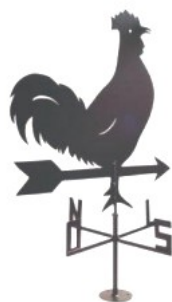
Fig. 2 – Catavento

Este aparelho serve para nos indicar de que lado sopra o vento e chama-se, por isso, catavento .