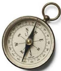
Fig. 4 – Bússola

campo, têm necessidade de conhecer, pelo menos, as oito direcções ou rumos a que já demos os nomes de, pontos cardeais e colaterais.